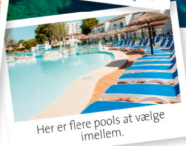
Her er flere pools at vælge imellem.