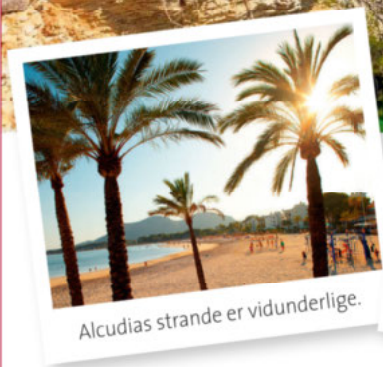
Alcudias strande er vidunderlige.