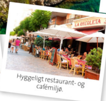
Hyggeligt restaurant- og cafémiljø.